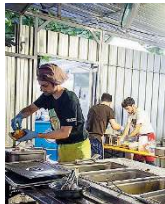
Eventi. Volontari impegnati nella passata edizione di MusicalZoo

L'Associazione «Volontari per Brescia» sta cercando que-