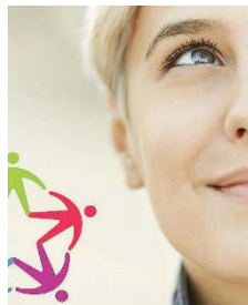
Opportunità. Il Servizio civile può esserlo

pena l'esclusione. Il Csv organizza giovedì 8 giugno alle 17.30 un incontro informativo rivolto ai giovani sul Servizio Civile in Italia e all'estero. Durante l'appuntamento che si terrà nella sede del Csv in via Salgari 43/B a Brescia verrà illustrato il Bando 2017 e intervengono alcune associazioni bresciane che daranno conto dei progetti attivi a Brescia e all'estero. Per partecipare all'incontro informativo inviare una mail con i propri dati a info@csvbs.it o telefonare al Csv tel. 0302284900.