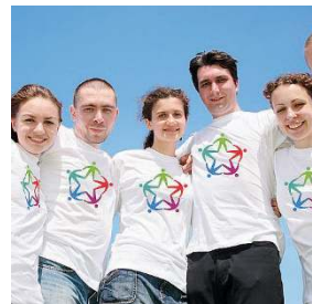
In Italia. Oltre 47mila i posti disponibili a livello nazionale