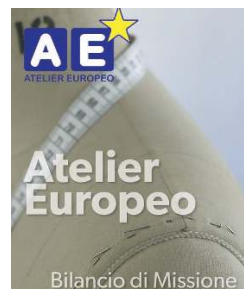
Bilancio. Il punto grazie al nuovo Bilancio di missione