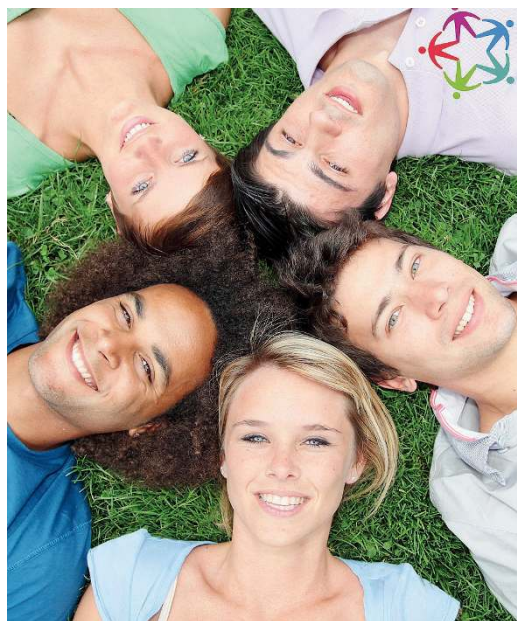
All'estero. Tra le opzioni percorribili, anche quella del Servizio civile all'estero: molte occasioni anche nel Bresciano