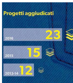
Raddoppio. Dai 12 progetti iniziali ai 23 varati nel 2016